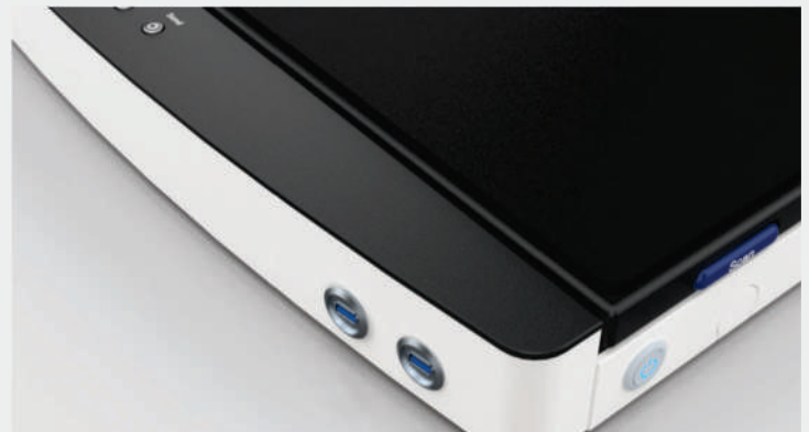
Almacene imágenes directamente en dispositivos USB 3.0