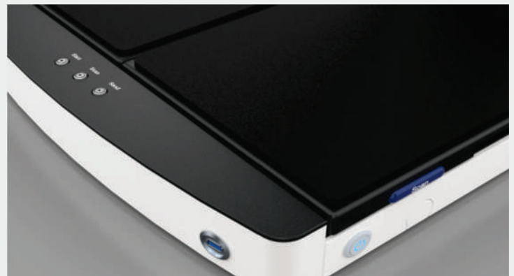
Almacene imágenes directamente en dispositivos USB 3.0

Garantía de cobertura total, hasta 5 años de repuestos y consumibles incluidos.