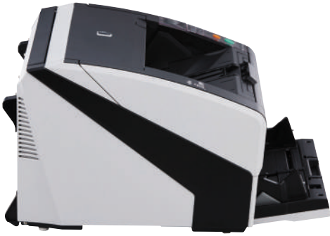
fi-7800 – A4 Horizontal a 300 dpi 110 ppm / 220 ipm fi-7900 – A4 Horizontal a 300 dpi 140 ppm / 280 ipm Digitalice lotes mezclados mediante el alimentador de 500 hojas