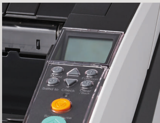
Panel de funcionamiento con pantalla de cristal líquido integrada

Para evitar averías, los escáneres fi-7800 y fi-7900 cuentan con un paso de papel hecho en metal que permanece inalterable con el paso de grandes volúmenes de papel, a diferencia de las estructuras de resina. Un novedoso sistema balancea la carga de papel en la bandeja de salida, lo cual alarga la vida de los componentes y maximiza la productividad.