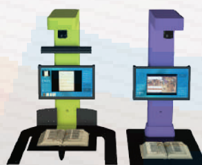
EJEMPLOS DE CONFIGURACIÓN DE SOBREMESA, PARA INSTALAR EL ESCÁNER EN SU PROPIO ESCRITORIO