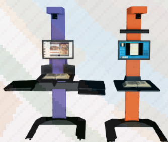
EJEMPLOS DE CONFIGURACIÓN PARA ESCÁNERES COMPARTIDOS EN PUESTOS DE AUTOSERVICIO