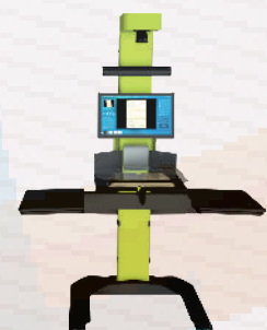
EJEMPLO DE CONFIGURACIÓN DE ESTACIÓN DE TRABAJO, EL ESCÁNER SE COLOCA EN EL SUELO Y EL USUARIO TRABAJA SENTADO